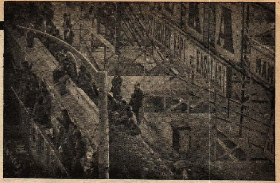
1. OLAYIN HEMEN ÖNCESİ: DAMDA YÜZE YAKIN İNSAN Yüze yakın insan Sular İdaresinin damında mitingi izliyor

Bundan sonrası halkımızın demokratik mücadelesine kalmıştır. Tertipçileri ve canileri, ancak güçlü bir kitle hareketi ortaya çıkarabilir ve hesap sorulmasını sağlayabilir. Tertipçiler ortadadır. Bunlar Namık Kemal Ersun ve adamlarıdır. Devletin koruduğu bu adamları sanık sandalyesine oturtmak, ancak güçlü bir mücadele ile başarılabilir. Önümüzdeki dönemin önemli görevlerinden biri de budur.