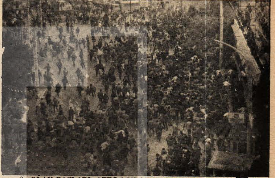
2. OLAY BAŞLADI: ATEŞ AÇILAN YERE KOŞULUR MU? Tarlabaşı girişinden kaçan kitle Sular İdaresinin önünde. Damdakiler ise onları seyrediyor.