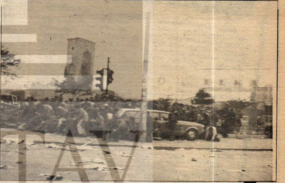
3. ANIT ÇEVARI: KİTLE SIRTINI SULAR İDARESİNE DÖN MÜŞ TEHLİKE KAZANCI YOKUŞUNDA